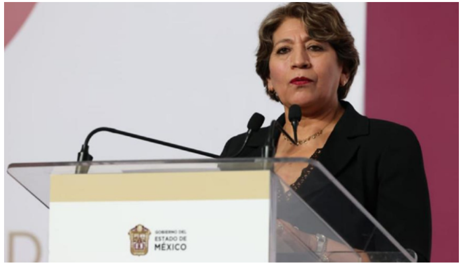
GABINETE MTRA. DELFINA GÓMEZ - 2023 AL 2029